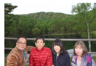
いました～ 小田原の妖精 4人組

だからこの日もその瞬間を撮ろうとカメラマニアがいっぱい。たしかに、日が差す前の静かな池と深く濃い緑は不思議なくらいハーモニーしてる。まるで妖精でもいるかのような。