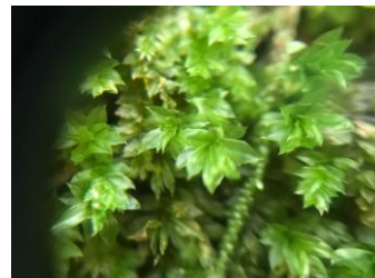
ほら、こにも苔にハマってる人が！

さて、奥入瀬渓流をただ歩いてみるだけじゃつまらないので楽しませるためのいろんな仕掛けがこのホテルにはある。まずは「森の学校」。そもそも奥入瀬渓流とはなんぞや？という説明を夜のロビーで30分スライドを見せながら講師が語る。客は車座になって聞くのだが「なるほど～」と明日からの散策に向け俄然テンションが上がるのだ。